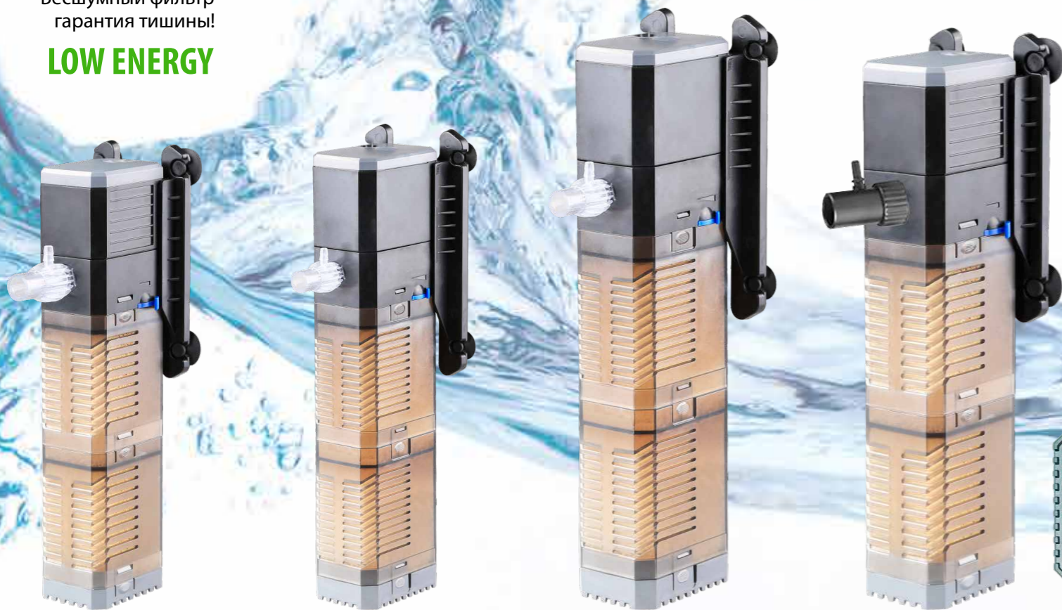
CHJ-502 CHJ-602 CHJ-902 CHJ-1502

Наиболее совершенная серия внутренних фильтров SUNSUN сочетает лучшие технические решения