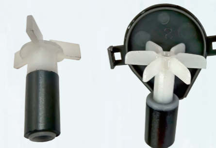
Импеллер с осью из нержавеющей стали: трехлопастной (в SP-500/600) или шестилопастной (в SP-700/601/602)