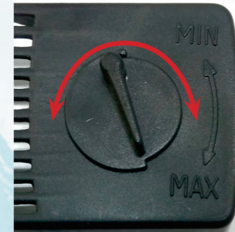
Плавная регулировка потока: слева – в моделях SP-500/600/700, справа – в моделях SP-601/602