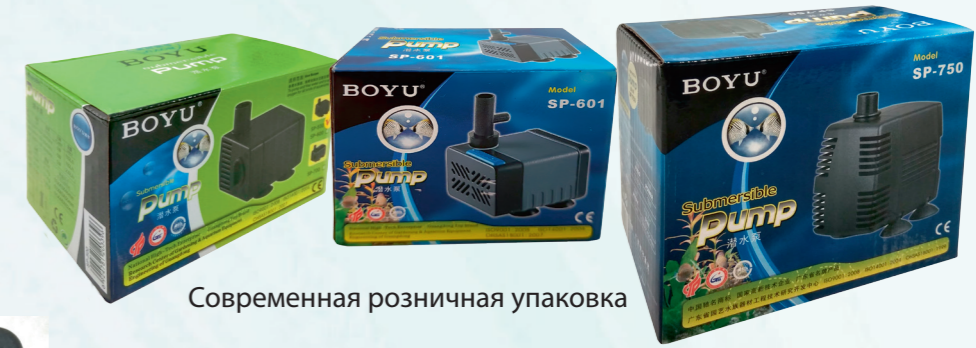
Современная розничная упаковка

МНОГОФУНКЦИОНАЛЬНЫЕ ПОГРУЖНЫЕ ВОДЯНЫЕ НАСОСЫ С РЕГУЛИРОВКОЙ ПОТОКА И ДОПОЛНИТЕЛЬНЫМИ ОПЦИЯМИ