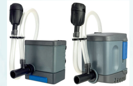
Модели SP-601 и SP-602 комплектуются трубкой для аэрации и регулятором подачи воздуха