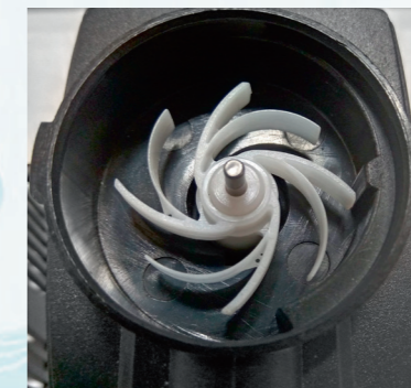
Инновационный импеллер с гибкими эллиптическими сдвоенными лопастями (только в модели SP-750). Бесшумность!