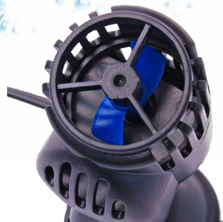
Уникальный запатентованный импеллер создаёт мощный волновой эффект и хорошее течение