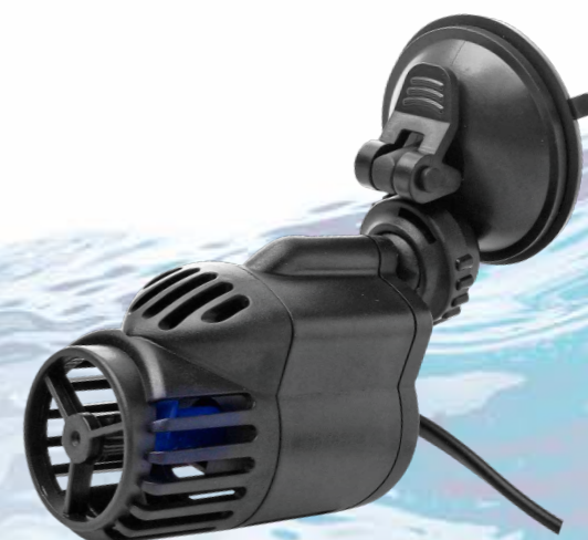
Можно расположить в любом положении и повернуть под любым углом