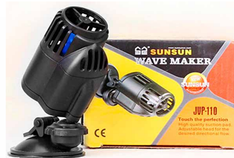
Красивая и аккуратная розничная упаковка