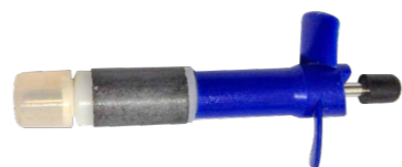
Вал ротора из износостойкой нержавеющей стали