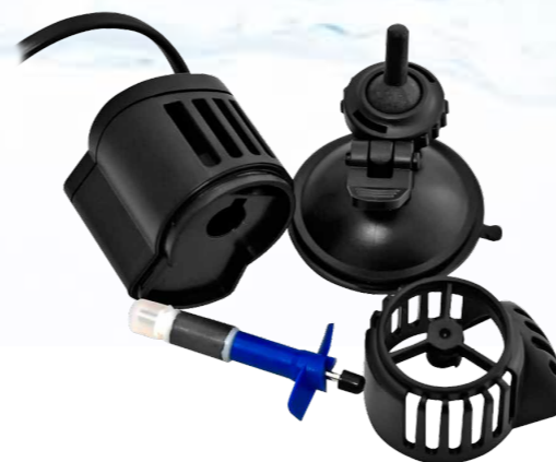
Легко разобрать, легко промыть, легко собрать