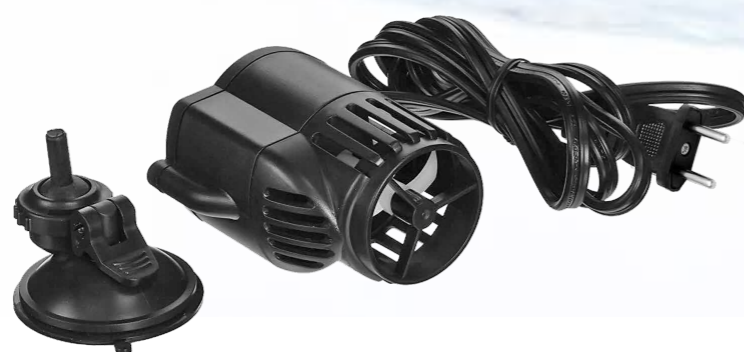
Сменная мягкая присоска на шарнире обеспечивает прочное крепление