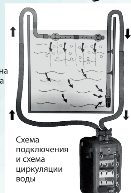
Схема подключения и схема циркуляции воды

УФ-лампа встроена в головку фильтра (кроме моделей с индексом «А»).